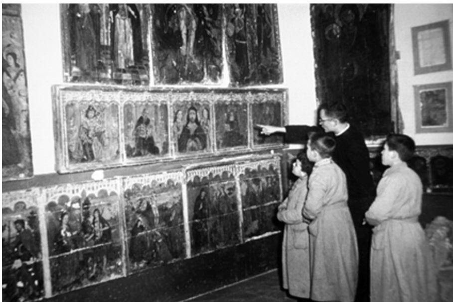
FIGURA 3. Vista del Museu Diocesà als anys 1950.