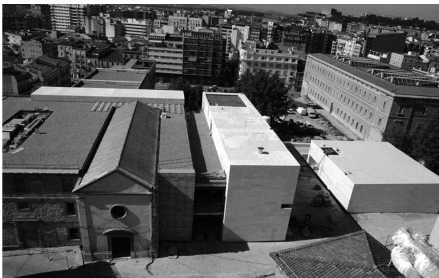
FIGURA 9. Futura seu del Museu de Lleida Diocesà i Comarcal.