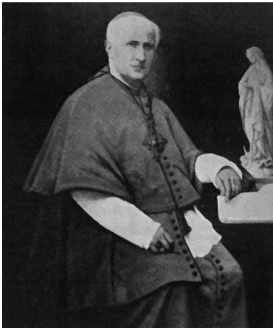
FIGURA 1. Bisbe Josep Meseguer i Costa.