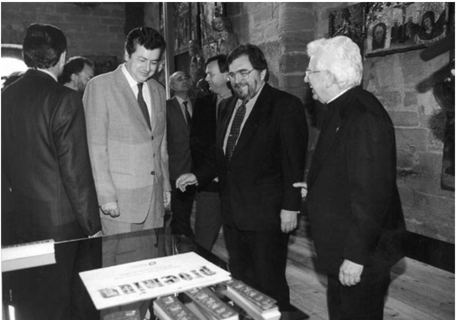
FIGURA 7. Inauguració de Prooemium, el 24 de desembre de 1997.