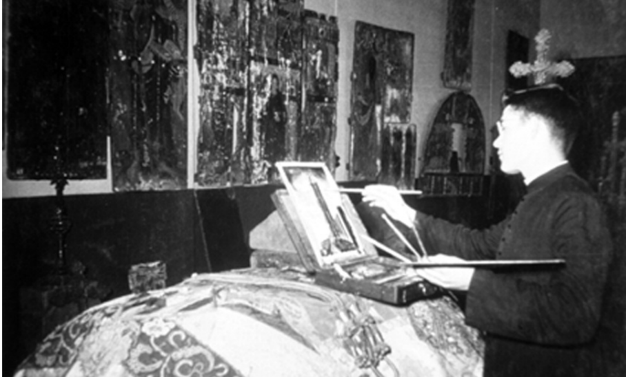
FIGURA 4. Vista del Museu Diocesà als anys 1950.