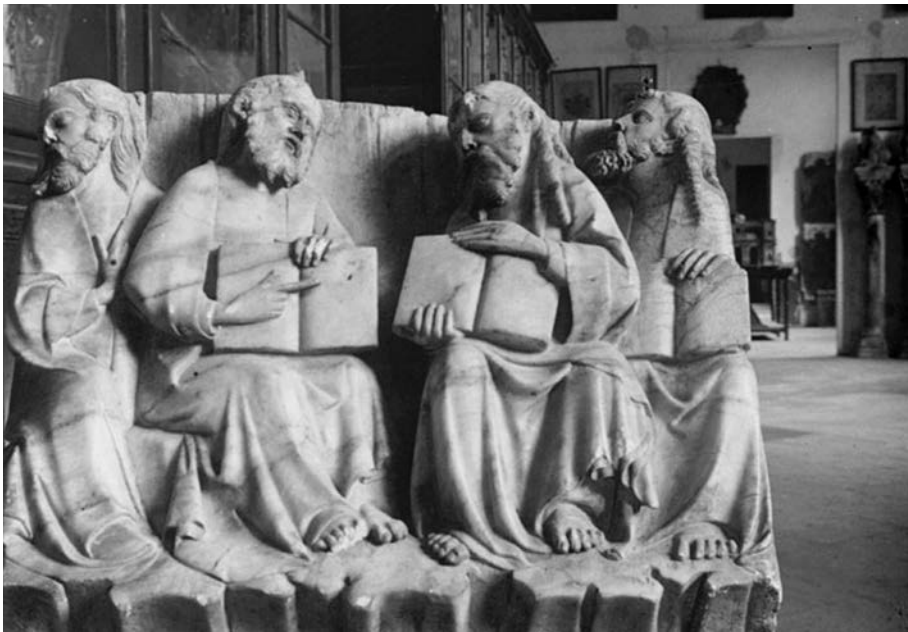
FIGURA 5. Vista del Museu Diocesà abans del 1936.