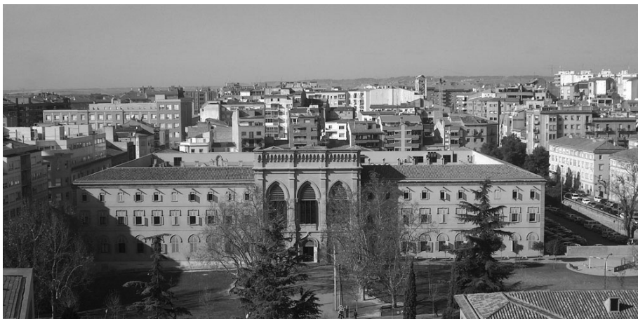
FIGURA 2. Vista de l'antic seminari (1893), seu del primigeni Museu Diocesà, actual edifici del Rectorat de la Universitat de Lleida.