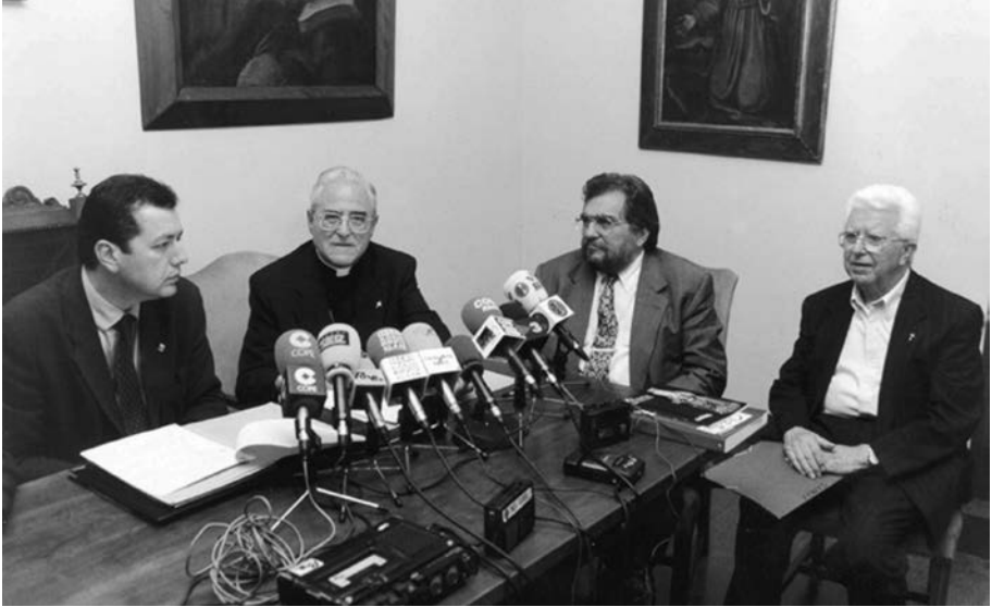
FIGURA 6. Signatura del Consorci, l'1 d'agost de 1997.